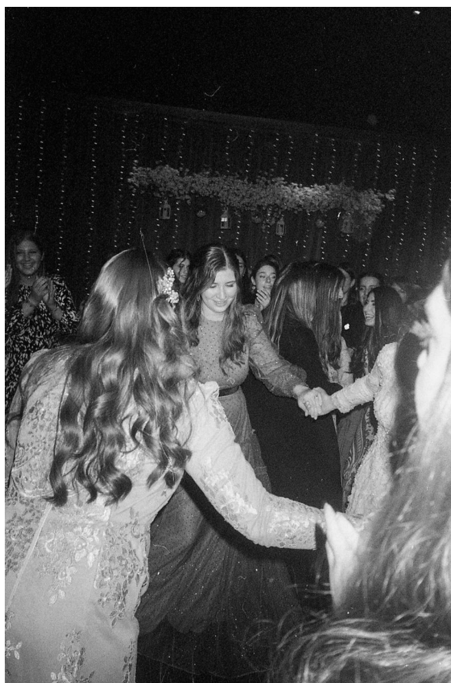
Casamiento III, Fotografía analógica, escaneada. Ciudad Autónoma de Buenos Aires, 2025.