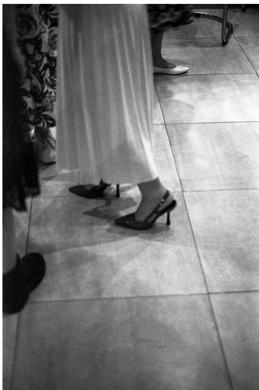
Despedida de soltera, Fotografía analógica, escaneada. Archivo personal. Ciudad Autónoma de Buenos Aires, 2025.