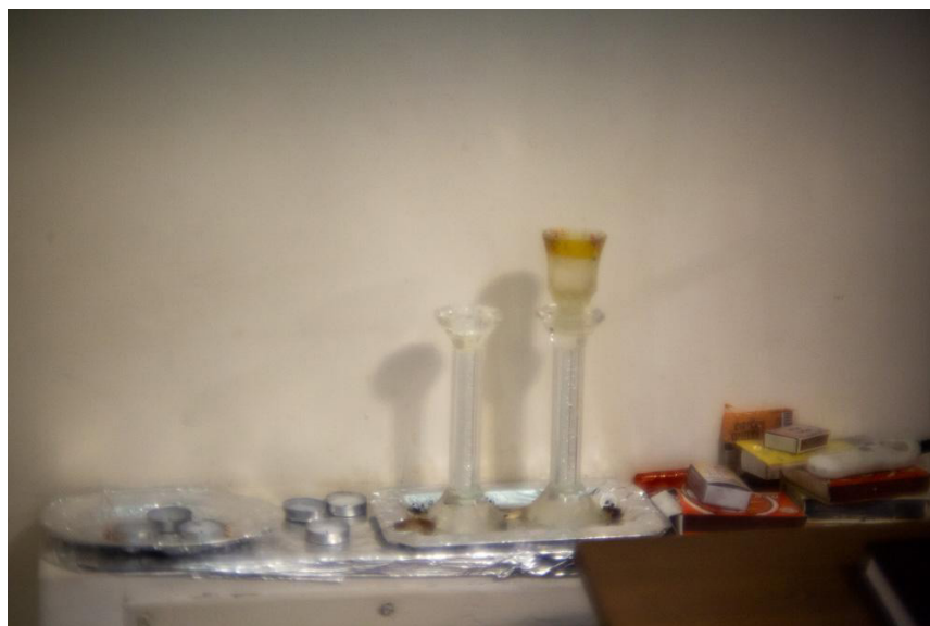
Encendido de velas, Fotografía digital. Tomada por la autora. Ciudad Autónoma de Buenos Aires, 2024.