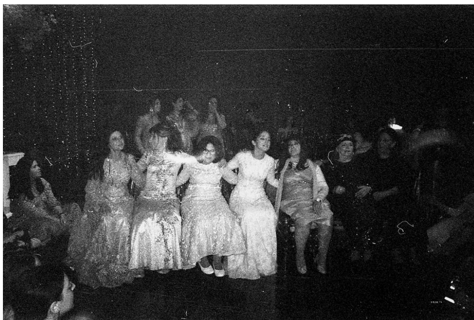
Casamiento II, Fotografía analógica, escaneada. Ciudad Autónoma de Buenos Aires, 2025.

de perfección espiritual interna, sino un acto deliberado de autoafirmación mediante el cual las mujeres “hacen religión” ( doing religion ) y negocian su pertenencia en la modernidad contemporánea.